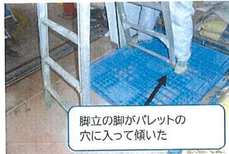
(シャッターの動作確認の状態) (脚立の片側をパレット上に置いていた)